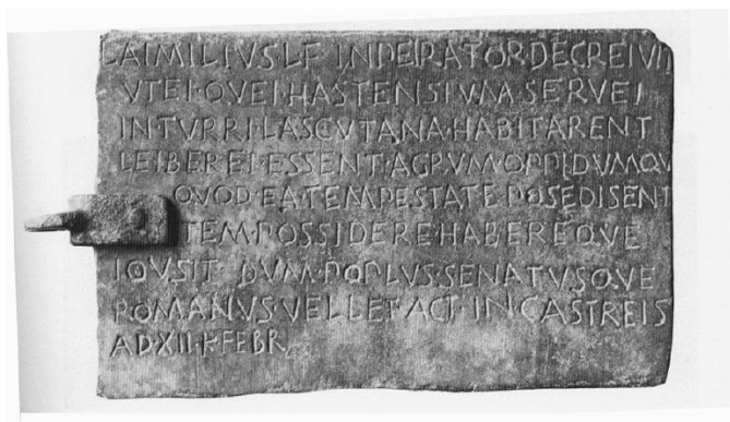
FIGURA 1. Tabula Lascutana . Gades. CIL I 2 614 (189 a.C.)