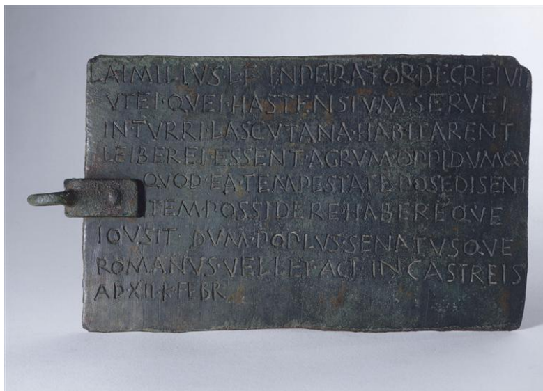
FIGURA 1. Tabula Lascutana. Gades. CIL I 2 614 (189 a.C.)

Fuente: Museo del Louvre. París.